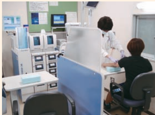
新設の採血・採尿受付機（左）と採血ブース。後ろにある機械は採血管準備装置（右）。