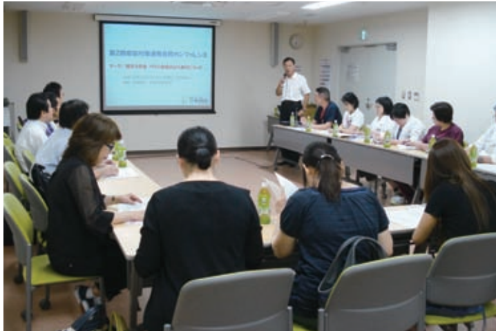
複数病院合同の感染制御カンファレンス

ひとくちに感染症といっても色々な種類があり簡単ではありません。それは多くの要因が複雑にからみあっているからです。原因となる病原微生物にはウイルス、細菌、カビ（真菌）、原虫、寄生虫など多種類があります。それぞれの微生物によってたくさんの疾病がひきおこされます。