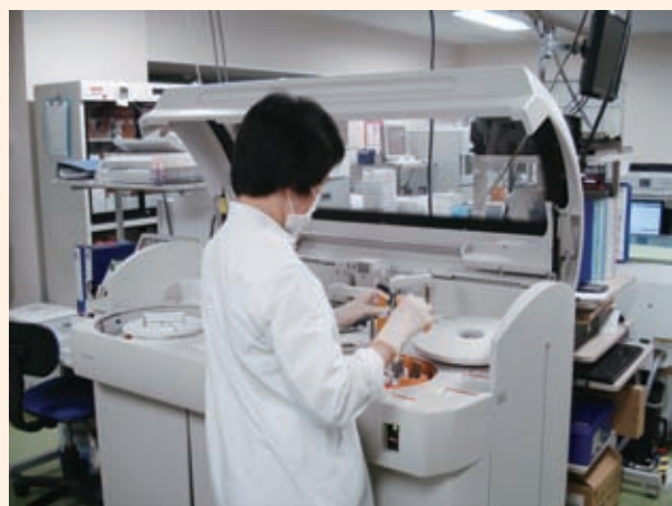
臨床検査室・生化学分析器

診療科目 内科 循環器内科 消化器内科 呼吸器内科 腎・高血圧内科 糖尿病内科 膠原病・リウマチ内科 脳神経内科 小児科 外科 整形外科 脳神経外科 麻酔科 泌尿器科 眼科 耳鼻咽喉科 婦人科 皮膚科 美容皮膚科 メンタルクリニック 放射線科 血液浄化センター 外来化学療法室 リハビリテーション科 健診センター 睡眠時無呼吸（SAS）センター