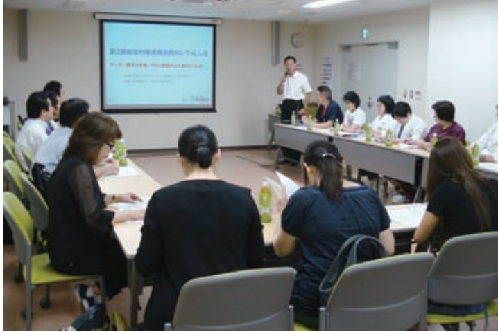
複数病院合同の感染制御カンファレンス

ひとくちに感染症といっても色々な種類があり簡単ではありません。それは多くの要因が複雑にからみあっているからです。原因となる病原微生物にはウイルス、細菌、カビ（真菌）、原虫、寄生虫など多種類があります。それぞれの微生物によってたくさんの疾病がひきおこされます。