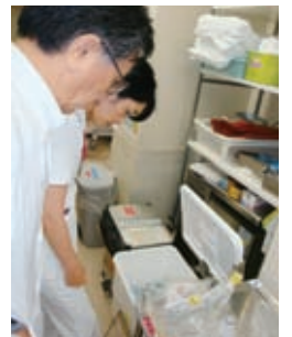
感染性医療廃棄物を監視しています。