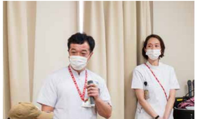
(ハートケア教室では各スペシャリストが講義します)

治療を受けずに放置されることも少なくありません。この生活習慣病の中で、最も多いのが高血圧であり、日本人の約3人に1人が高血圧に罹患していると言われております。ゆえ、心不全発症を阻止するために、治療すべき第一の生活習慣病は“高血圧”と考えられます。私たちは、この“高血圧”と“心不全”の患者さまのために、2025年10月～ハートケア外来およびハートケア外来を開設致しましたので、是非、ご活用頂